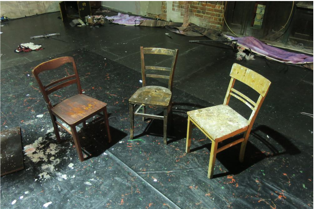
Der Frankenstein Raum: